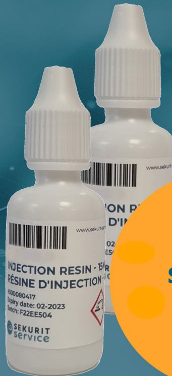
Sekurit Service Iagningsresin 15ML 9201136120